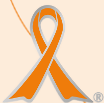
イラスト 佐々木理沙 2015年度 オレンジリボン運動 公式ポスターコンテスト SBI子ども希望財団賞受賞作品

次世代の健全な育成という視点から、一般市民等を対象としたフォーラムを開催します。