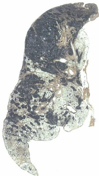
右) じん肺 (粉じんの吸入により肺が黒くなっている。)