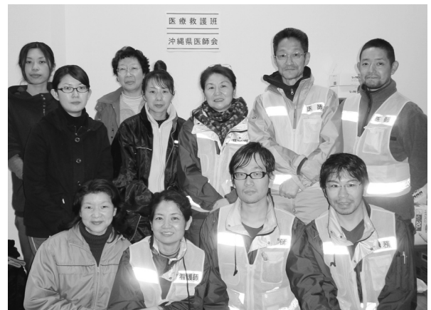
Fig.21 保健師さんたちと。