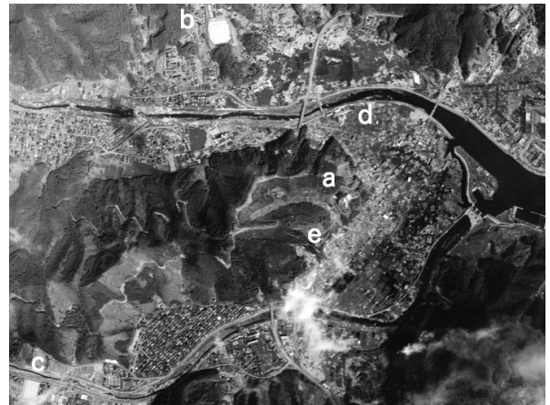
Fig.8 大槌町の被災後の航空写真。高台以外は全て津波で壊滅。 a.城山公園と中央公民館・城山体育館, b.大槌高校, c.弓道場 (この3カ所が大規模な避難所となる)。 d.県立大槌病院, e.大槌小学校 (病院と小学校は町全体とともに壊滅)。