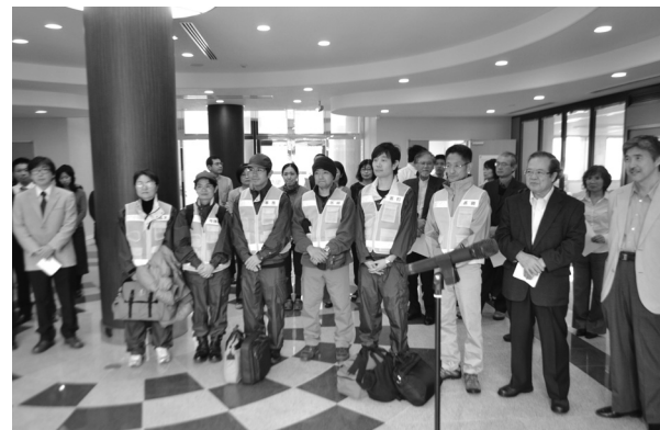
Fig.1 県医師会館での出発式。