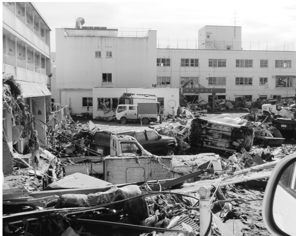
Fig.18 壊滅した県立大槌病院。閉鎖となる。

3月19日(土) 雪も溶けて晴れた朝をむかえる。町の中心道路の瓦礫の撤去も進む。携帯電話の電波を求めて町に降りる。津波と火災の威力を目の当たりにする (Fig.18,19)。