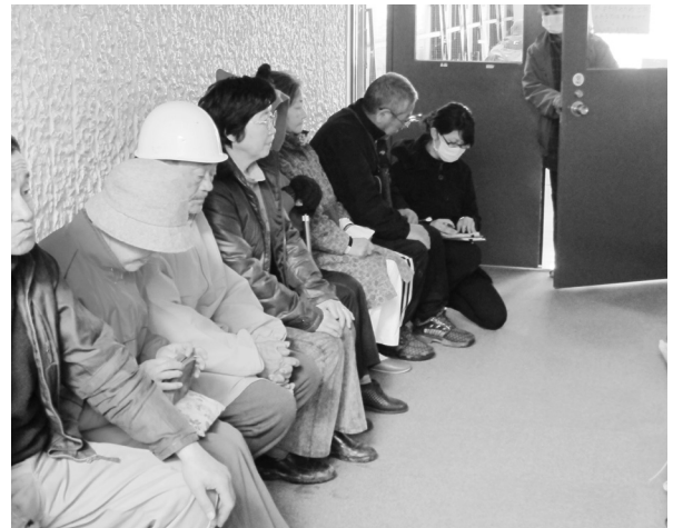
Fig.12 診察の順番を待つ方々。

が列ばれる（Fig.12）。保健師さんと診療について協議、患者数が全く未知のためにはまずは1日処方、血圧は160/or/110以上を投薬対象、緑内障は診療所に来て頂き点眼することとして診療開始。ほとんどの方が被災前に服用されていた薬を流されたとのことで受診（Fig.13）。