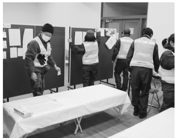
Fig.9 仮設診療所の設置開始。

知症などで介助が必要な独居の方々の避難所でもあるため、部屋の3分の1を畳んだ卓球台で仕切る (Fig.9)。