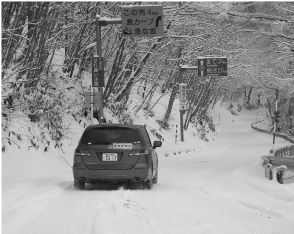
Fig.6 吹雪と積雪のなかでの山越えとなる。

○14時20分 遠野市を出発。35号線の途中まで遠野市が先導車を出して下さる。山越えの道では吹雪と積雪となる (Fig.6)。