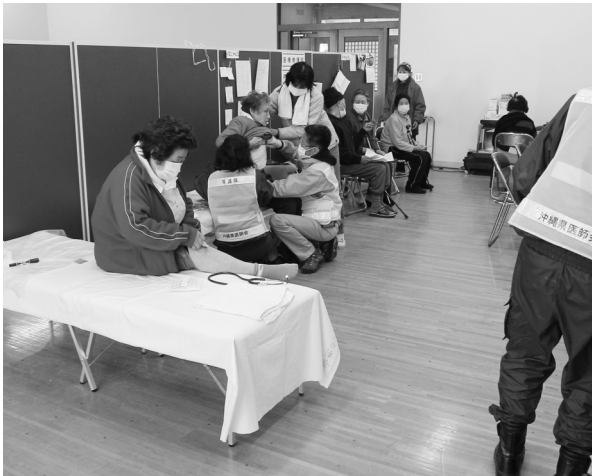
Fig.14 避難時に受傷された方。

避難所の食事状況を調べたところ1日2食で全600Kcal位と判明。多くの患者さんは被災前よりも血圧は改善しており、インシュリン10Uを自己注射されていた方もインシュリンがなくても血糖値が300前後。疾患別には高血圧、糖尿病、不眠、不安神経症、消化器疾患そして緑内障など。肋骨骨折にはシーツを割いて代用 (Fig.14)。