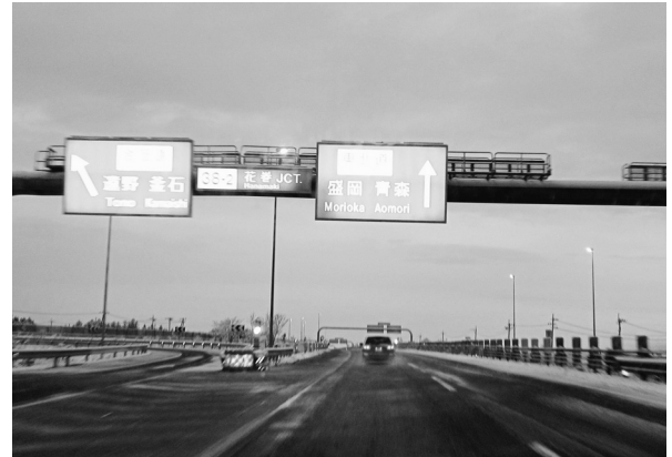
Fig.3 明け方に岩手県に入る。

3月16日(水) 夜も明けるところ、東京から約550kmを走破して岩手県に入る (Fig.3)。