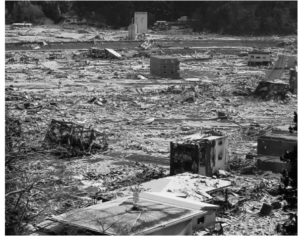
Fig.11 城山公園から見た町の中心部近辺。

○21時07分 隣の安渡地区の避難所から下痢、嘔吐者が数名発生し日中に巡回診療を受けたものの状態が悪化したため往診の依頼あり。役場職員の車両で出動し治療に当たる。帰還する途中、降雪のなか城山体育館に上がる山道で車両が雪にスタックして危うく遭難。通りかかった4輪駆動車に救出されるというアクシデント発生。そのころ仮設診療所では保健師さん1名が過労のために倒れる。保健師さんらも被災されてこの避難所で寝泊まりしながら職務に就いておられることを知る。出発してから34時間が経過、県医師会事務局の方々の心のこもった夕食（パン）を有り難くいただき各々寝袋へ入る（Fig.10）。