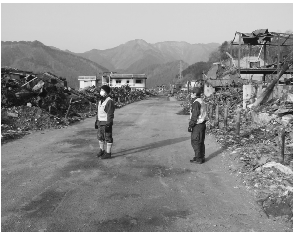
Fig.19 土砂や瓦礫が撤去された大槌町のメインストリート。