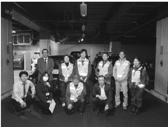
Fig.2 沖縄県東京事務所の方々に見送られる。

○緊急車両通行証にて真っ暗な東北自動車道を北上、途中4ヶ所のSAで幸運にも給油することができる。路面は地震の影響で段差や亀裂があり、さらに夜半には降雪となり明け方には路面がシャーベット状となり思うようにスピードを出すことが出来ない。