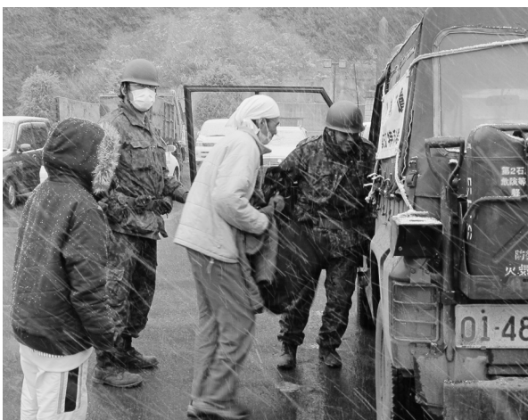
Fig.15 吹雪くなか自衛隊の車両で盛岡へ搬送。

○17時46分 潰瘍性大腸炎の方が津波にて内服薬を流失、粘血便、腹痛、発熱などの症状が悪化したために自衛隊車両にて岩手医科大学へ搬送 (Fig.15)。夜、避難所の夕食に紙コップ半分ずつの暖かいみそ汁が配られるのを見て、我々も現地入り初の暖かいもの (カップヌードル) を食べる。