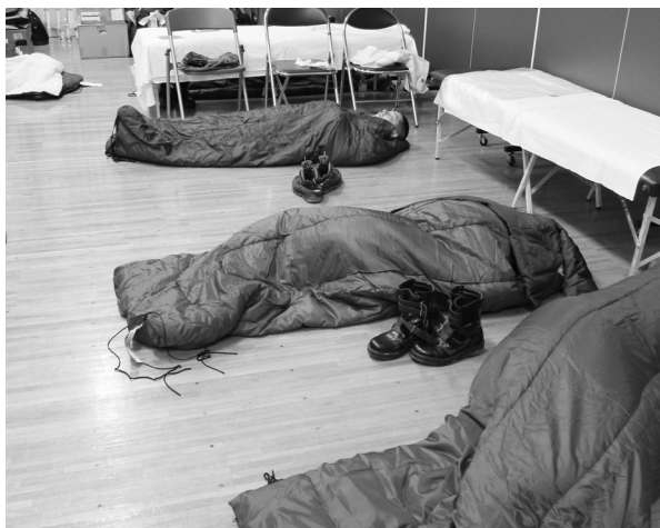
Fig.10 仮設診療所で寝袋に入り就寝。