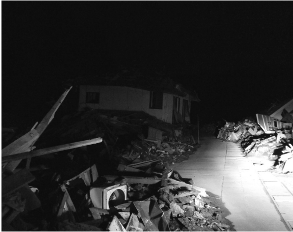
Fig.17 暗闇のなか救急要請のあった避難所へ向かう。

3月19日(土) 雪も溶けて晴れた朝をむかえる。町の中心道路の瓦礫の撤去も進む。携帯電話の電波を求めて町に降りる。津波と火災の威力を目の当たりにする (Fig.18,19)。