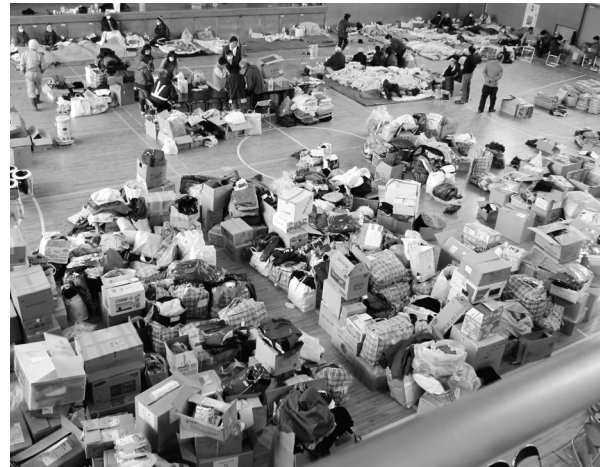
Fig.16 避難所に次々と運び込まれた救援物資。

雪がちらつく朝をむかえる。気温は氷点下。大槌町から釜石に通ずる幹線道路が開通。さらに城山公園から町へ降りる道が開通。急に多くの支援物資が中央公民館に届くようになる。避難所の方々へ歯磨きセットが届く。水も1人当たり2本以上配られるようになる (Fig.16)。