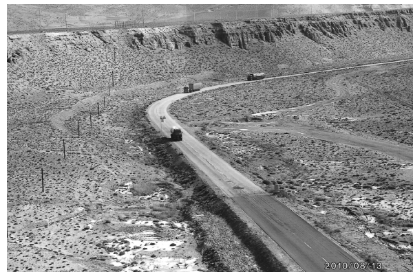
写真2. 青藏鉄道沿いを走る青藏公路、西寧とラサ間の大動脈である。

青藏鉄道は中国にとっては、まさにチベットへの物流、および漢民族移動、軍用列車の交通網の完成であるが、チベットにとっては、中国のチベット侵略の象徴であり、またチベットの自然破壊、豊かな地下資源の略奪・搬出路である（写真2）。