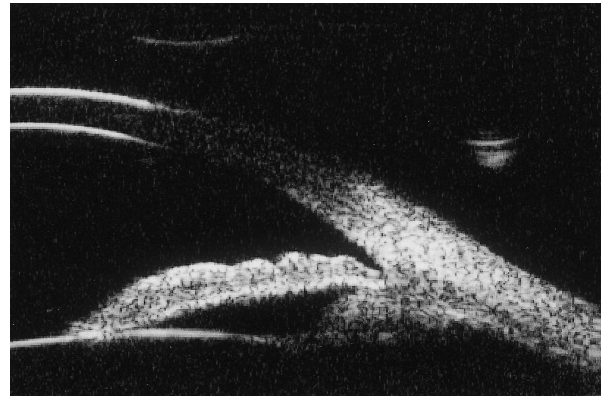
図2. 開放隅角のUBM所見 角膜-虹彩根部は広く開大しており、隅角（線維柱帯）は解放している。