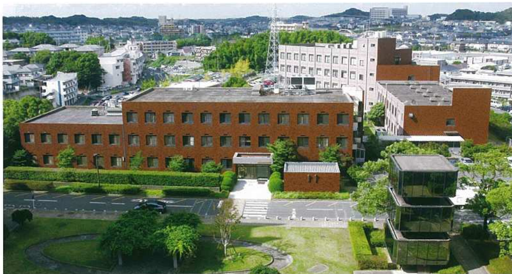
産業医科大学 産業生態科学研究所