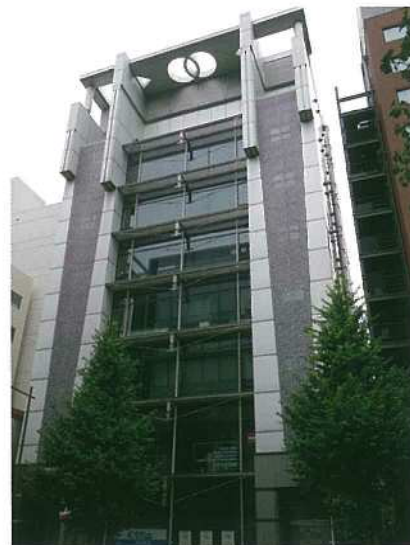
産業医科大学 東京事務所