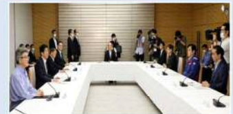
令和2年7月豪雨時の非常災害対策本部