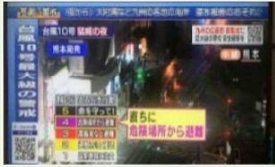
避難情報の報道イメージ（内閣府で撮影）

避難勧告・指示を一本化 し、従来の勧告の段階から 避難指示 を行うこととし、避難情報のあり方を包括的に見直し。