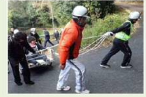
避難行動要支援者が災害時に避難する際のイメージ