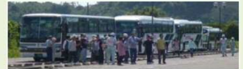
大規模河川氾濫時の他市町村への避難イメージ

災害発生のおそれ段階において、国の災害対策本部の設置を可能とするとともに、市町村長が居住者等を安全な他の市町村に避難（広域避難）させるに当たって、必要となる市町村間の協議を可能とするための規定等を措置。