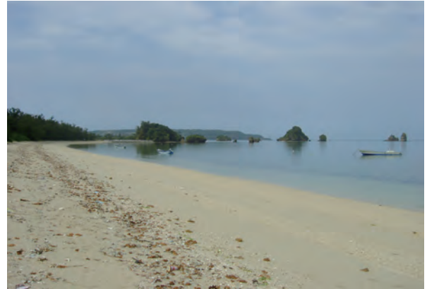
屋我地島のビーチ（港ができる前）

つぎに、第2の故郷である沖縄についてお話ししたいと思います。私は小学生になる前に沖縄に引っ越してきました。沖縄に引っ越してからは環境の変化のためか小学校時代は小児喘息で悩まされ、夜中の発作で両親には大変心配をかけました。その小学校時代から、父の故郷である屋我地島にはお盆やお正月など何かの機会に親戚一同が集まり、裏にある海で遊んだり、祖父の飼っているヤギに餌をあげたり、ゲートボールを教えてもらったりと昔懐かしい沖縄らしい時間を過ごしました。しかし、小中高大と学年が上がり、祖父母も他界した後は、仏壇がある屋我地島には清明祭やお盆、お正月の年に3回も行くかどうかとやや足が遠のいていましたが、第一内科に入局すると毎夏恒例の屋我地島でのヒージャー会が催され、皆で持ち寄り泊りがけで行うBBQ（釣り師はイカや魚をたんまり）には新入医局員もしっかり駆り出されました。年月を重ね、家族を持つことで、先祖への感謝の念が高まり、まとまった休日があれば仏壇へのあいさつと自然に触れるために家族全員で屋我地島へ向かうことが多くなりました。最近では観光ブームのため屋我地島は古宇利島への通り道ということでレンタカーの交通量が大変多くなり、サトウキビ畑がどんどん新しい道に代わってしまいました。かつて私が好きだった畑の間の道の向こうに見えた素晴らしい海の光景も見られなくなり、さらに裏にあった海辺には地元漁師のために立派な港が建設され、それ以降、潮の流れがガラッと変わり、自然の砂浜は大幅に侵食され、昔ながらの素晴らしい風景が少しずつ消えていることは非常に残念に思います。とは言うものの、屋我地島から本部半島（今帰仁）へワルミ大橋がかかったことで大変交通の便が良くなりました。