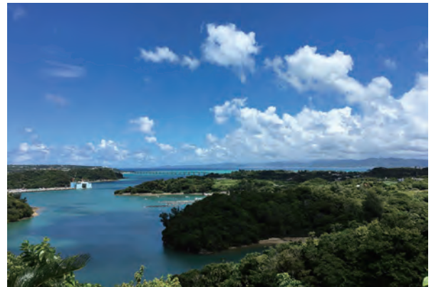
リカリカワルミ展望台より

このワルミ大橋の展望台からは、澄みきった広い青い空と東シナ海の深い青、古宇利大橋の手前にはやんばるの緑とおだやかな羽地内海の彩り豊かな風景が広がっており、いつ来ても心を癒してくれます。