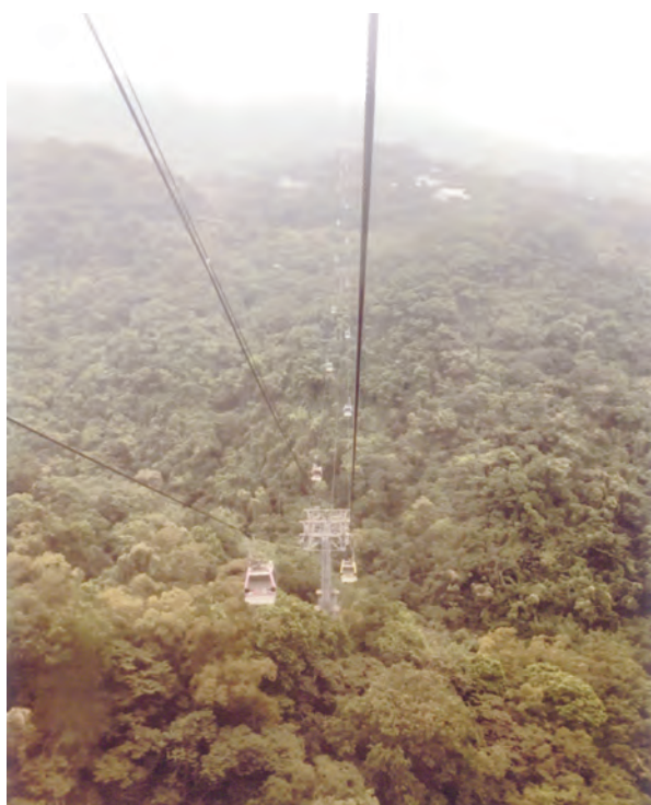
1. 猫空ロープウェイ

1 日目は、昼過ぎに台湾桃園空港に到着、ホテルでチェックインを済ませ、お腹も空いてきたので、小籠包で有名な鼎泰豊へ向かいました。お昼時間を過ぎていたので 20 分程で入れました。(混雑時は 1 時間以上待ちます) 小籠包、野菜炒め、鶏肉のスープなどどれもとても美味しく、また今回はトリュフ入り小籠包も食べてみましたが、濃厚なトリュフの香りが口いっぱいに広がりました。お勧めです。食事のあとは、目的地の猫空に向かいました。猫空は台北の南郊外に位置し、近くの動物園駅まで台北メトロで行き、5 分程でロープウェイ乗り場に着き、そこからロープウェイに乗り、標高約 300 m まで 4km を上っていきます。約 1/3 程進むと、90 度方向変換し、上ったり下ったり急な山の斜面に沿って進んで行きます。遠くに台北市街と眼下に茶畑 (木柵鉄観音茶の産地です) を見ながら、30 分程で中腹の猫空駅に到着します。駅周囲には食事やお茶が楽しめる茶藝館が茶畑の中に点在し、カップルに人気のデートコースとのことです。ゴンドラは床が透明な物もあり (スリル満点)、台北で時間があり高所恐怖症でなければ是非乗ってみて下さい。楽しめます。(写真 1)