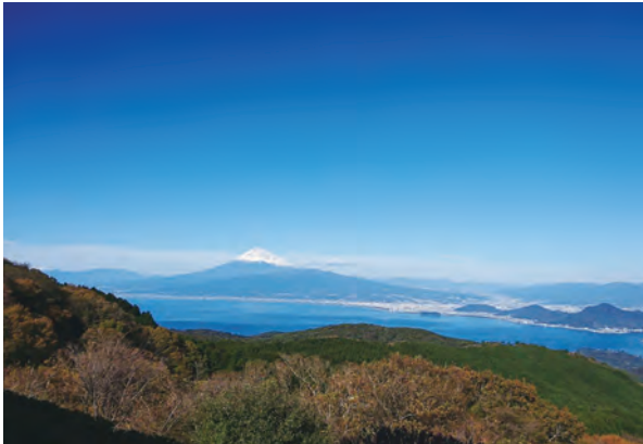
達磨山から望む富士山（家内がスマホで撮影）

だわっている。最初に行った旅での写真が好評だったので、以来いっばしの写真家気取りである。3つ目は、旅を終えた後から、行った先がテレビなどで放映されるのを見た時である。あの時はああだったこうだったと家内と思い出話に花を咲かせたりする。