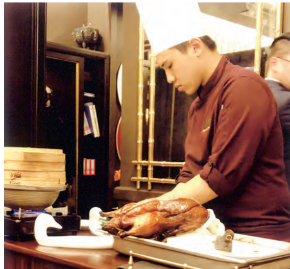
2. 國賓大飯店の北京ダック

夜は、ぜひ一度行ってみたいと思っていた、北京ダックが評判の國賓大飯店のレストラン川菜庁に行きました。お世話になっている台北駐日経済文化代表處の所長 (領事) さんが台北でもとても美味しいとお勧めのレストランです。川菜庁は、今年 3 月、ミシュランガイド台北版の推薦レストランです。ローストされたばかりのダックをワゴンに乗せ、その場でシェフがパリパリで香りの良い皮とジューシーなお肉を切って出してくれ、ねぎとキュウリと特製の味噌を烤鸭餅 (カオヤーピン) で包んで食べ、残りの鴨肉 (アヒル) は他の具材と合わせて土鍋でスープを作ってくれて、とても美味しくいただきました。(予約が必要です) (写真 2) *同ホテルには、プロゴルファーの宮里藍さんが美味しいと TV で紹介していたステーキハウス: A Cut Steakhouse もあります*